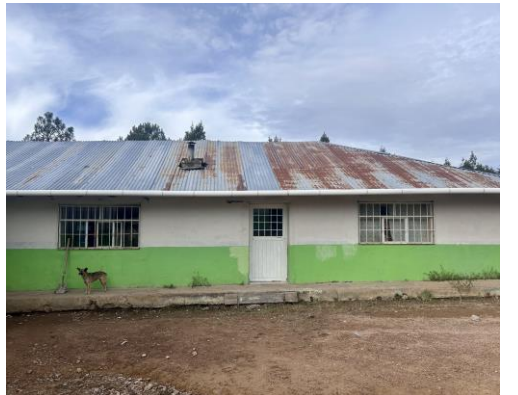
Imágenes de las escuelas visitadas, autoría propia, 2023.