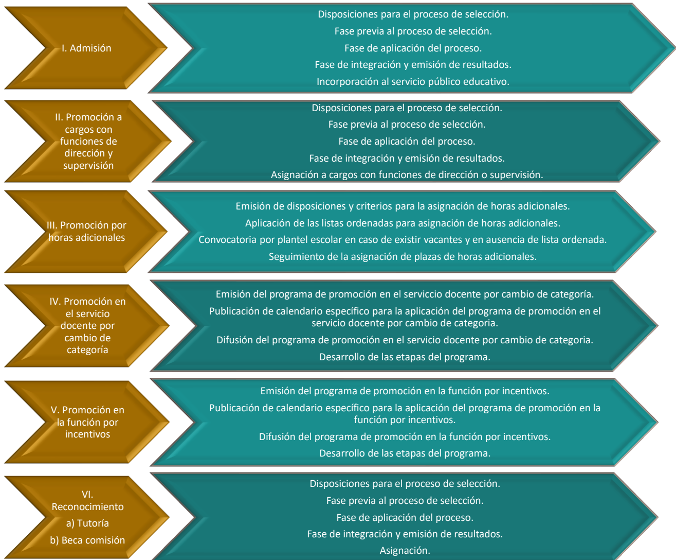
Figura 2. Procesos de selección en Educación Media Superior