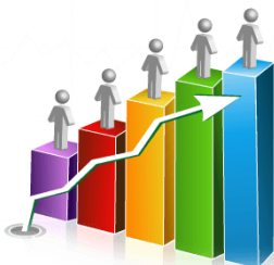
EVOLUCIÓN DE LA COBERTURA

La cobertura del Programa ha presentado algunas variaciones en los últimos tres años. en el año 2017 la cobertura aumentó en un 13% respecto al año 2016, sin embargo, en el año 2018 presentó una disminución del 5.3% respecto año anterior.