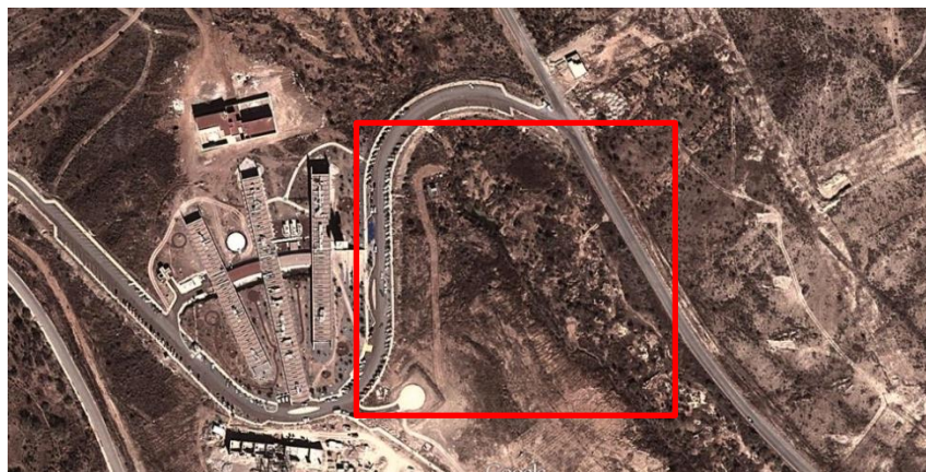
Gráfico 3. Ubicación de Proyecto de Sustitución de Hospital de Gineco-Obstetricia de Parral

Fuente: Dirección de Planeación, Evaluación y Desarrollo. Secretaría de Salud del Estado de Chihuahua, 2017.