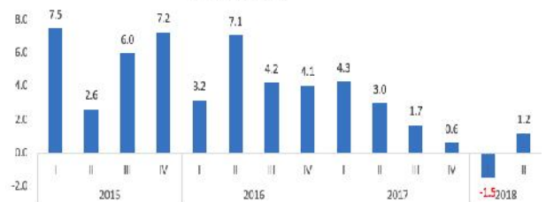
Indicador Trimestral de la Actividad Económica (Variación porcentual)