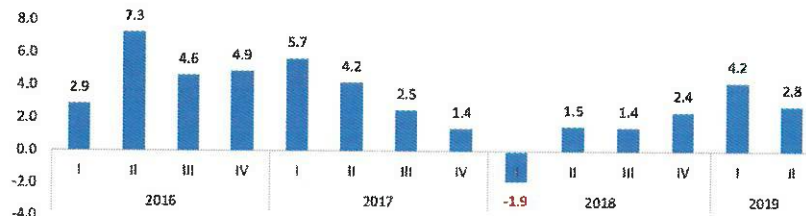
Indicador Trimestral de la Actividad Económica (Variación porcentual)